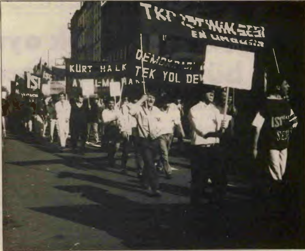
Fransa'da 1 Mayıs yürüyüşünde en kalabalık kortejlerden biri de bizim kortejimizdi.

Yoldaşlar bu kısa mektubumda sizlere Fransız Komünist Partisi'nden bir örnek vermek istedim. Ama bununla yetinmek söz konusu değil. FKP, Türkiye işçi sınıfı açısından başına incelemeye değer. Bugün düştüğü durumun altında, kısaca söylemek gerekirse, komünist partisi adını taşıyıp komünist