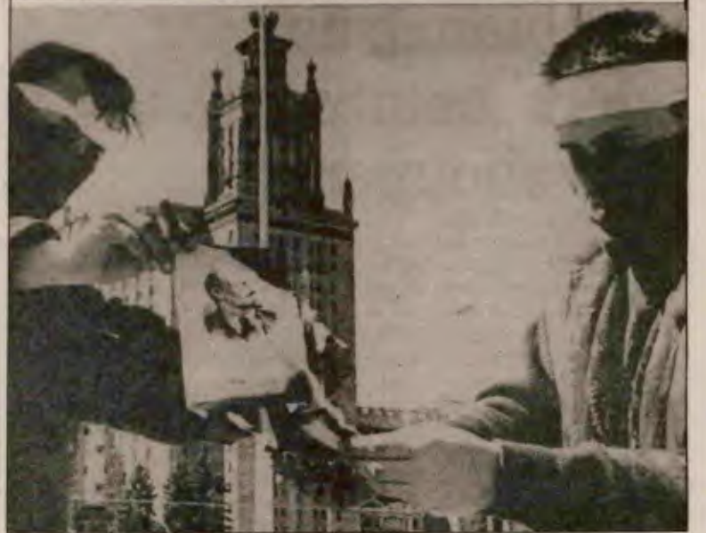
Üstteki resim: Moskova Sovyeti'nin yeni liberal yöneticileri, Lenin büstünün altında, “serbest pazar” a geçiş için gerekli “önlemleri” görüşüyorlar. Alttaki resim: Yüzlerini saklayan anti-komünistler, Gorbaçov'tan aldıkları cesaretle, Moskova Üniversitesi'nde Lenin'in yapıtlarını yakıyorlar.